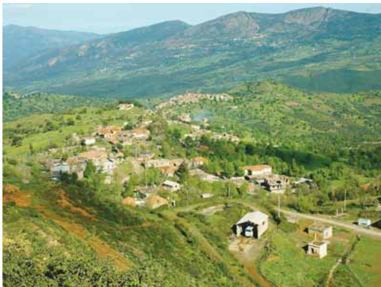
Les banques publiques sont appelées à mettre fin à leur politique d'austérité lorsqu'il s'agit d'octroi de crédits pour le financement des activités agricoles en zones de montagne

Tenant compte de l'ensemble des aspects qui caractérisent l'économie agricole en Algérie, le rôle que devrait potentiellement jouer la montagne dans le processus de développement ne peut en aucun cas être occulté. Certes, dans le sillage des multiples mesures envisagées ces dernières années, le gouvernement semble manifester un intérêt relatif à l'égard des zones montagneuses, en escomptant de leur restituer la place qui devait être la leur à travers les projections envisagées pour le développement des activités agricoles en Algérie. Mais sur le terrain, les défis sont nombreux et le climat contraignant qui persiste retarde encore le défilé d'une réelle agriculture de montagne ou d'une économie rurale. Eu égard à son relief géographique fortement dominé par la montagne, (plus de 80% de la superficie totale de la wilaya est à caractère montagneux), la wilaya de Tizi Ouzou a ainsi toutes les latitudes pour être parmi les régions prioritaires en matière d'affectation des projets destinés à la relance de l'agriculture en zones de montagne. En tout cas, depuis la mise en œuvre de la nouvelle politique agricole, incarnée par le PNDRA, (Plan national de développement rural et agricole), de multiples efforts ont été consentis pour le soutien de certaines activités agric-