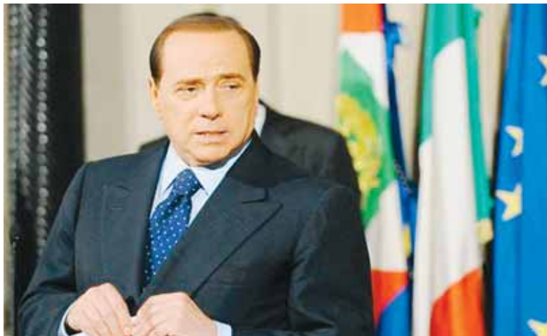
Le gouvernement de Silvio Berlusconi table officiellement sur une croissance de 0,1% en 2008 et de 0,5% en 2009

Par rapport au troisième trimestre 2007, le PIB s'est contracté de 0,9%, a également confirmé l'Institut. Au deuxième trimestre, le PIB s'était déjà replié de 0,4% par rapport au premier trimestre. Le recul du PIB au troisième trimestre est dû à une baisse de la demande nationale globale et de la demande étrangère de 0,3% ainsi qu'à un repli des investissements de 0,4%, a précisé l'Istat. En revanche, la consommation des ménages a continué à légèrement progresser de 0,1%. Par secteurs, la valeur ajoutée de l'agriculture s'est repliée de 3%, celle de l'industrie de 1,4% (construction comprise) et celle des services de 0,2%. L'Italie n'avait pas connu de récession technique (deux trimestres consécutifs de recul du PIB) depuis le dernier trimestre de 2004 et le premier trimestre de 2005, où le PIB s'était contracté de 0,2% et de 0,1%. Et un sombre quatrième trimestre semble désormais se profiler pour la troisième économie de la zone euro, la production industrielle ayant reculé à nouveau de 1,2% en octobre, selon des données publiées également par l'Istat. Le gouvernement de Silvio Berlusconi table toujours officiellement sur une croissance de 0,1% en 2008 et de 0,5% en 2009, mais ses prévisions ont été établies en sep-