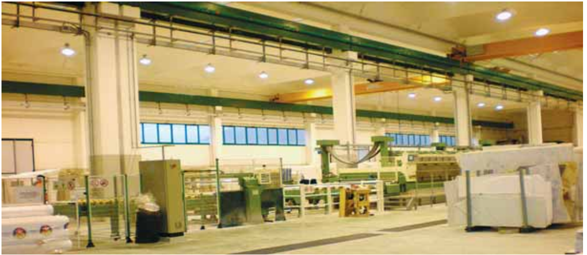
Unité de production de marbre à Carrara