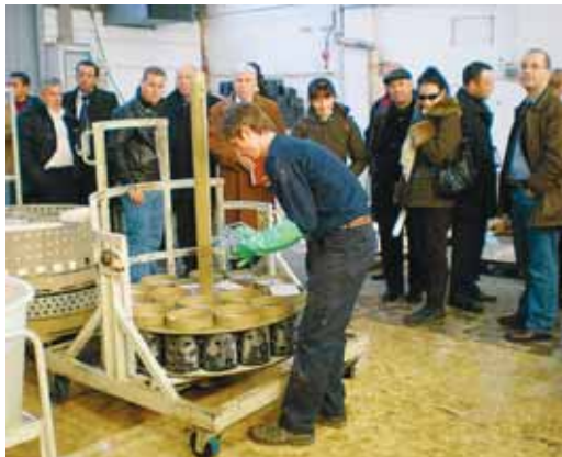
Délégation algérienne à l'usine de fabrication de cristal «La bottega» à Empoli (Toscane)

En Italie 99% des entreprises sont des PME dont 95% sont des micro-entreprises avec moins de 9 employés. Ainsi, la dimension de la PME italienne est inférieure à celle des autres Pays de l'Union européenne. 55% opèrent dans l'industrie manufacturière contre 35% dans l'Union européenne. La majeure partie des entreprises sont à caractère familial et opèrent dans les secteurs traditionnels. Des entreprises qui se regroupent en consortium à l'export au nombre de 420. Les premiers consortiums ont vu leur naissance dès 1970 afin d'aider les PME à exporter dans le monde entier. Quelques 200.000 entreprises exportatrices, réalisant un chiffre d'affaire à l'export de 356 milliards d'euros font de l'Italie un pays exportateur par excellence, dira M. Lorenzo Papi, responsable à Federexport, un groupe de consortium d'exportation, rencontré au siège de l'institut italien pour le commerce extérieur (ICE) à Rome. Pour lui, les PME face à l'export doivent dépasser plusieurs écueils comme le manque de ressources financières et professionnelles, une productivité basse et un manque d'investissement en recherche et innovation, entre autres. D'où, indique-t-il, la nécessité pour elles de « travailler