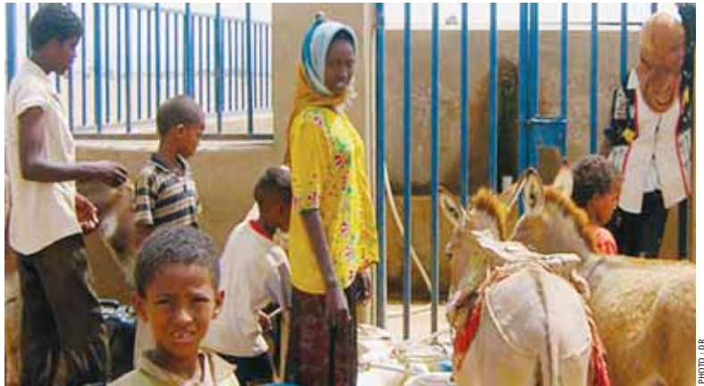
Les pays du Proche-Orient et d'Afrique du Nord sont en général ceux chez qui les taux de sous-alimentation sont les plus bas du monde en développement

Les prix des principales céréales ont chuté de plus de moitié par rapport aux sommets atteints début 2008, mais ils restent élevés comparés aux niveaux des années précédentes. Bien qu'il ait fortement baissé au cours des derniers mois, l'indice FAO des prix des denrées alimentaires était, en octobre 2008, toujours plus haut de 28% par rapport à son niveau d'octobre 2006. Les prix des semences, des fertilisants (et d'autres intrants) ayant plus que doublé depuis 2006, les paysans pauvres n'arrivent plus, selon la FAO à augmenter leur pro-