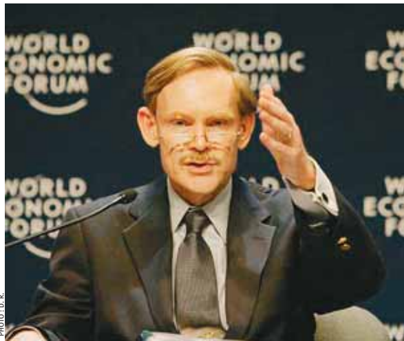
Robert Zoellick, président de la Banque mondiale

En Afrique subsaharienne, la croissance a augmenté en 2008 atteignant 5,4%, mais devrait retomber à 4,6% en 2009, souligne la Banque mondiale. Dans la région Asie de l'Est et Pacifique, on estime que la croissance du PIB devrait ralentir à 8,5 % en 2008 et descendre à 6,7 % en 2009. La région était confrontée