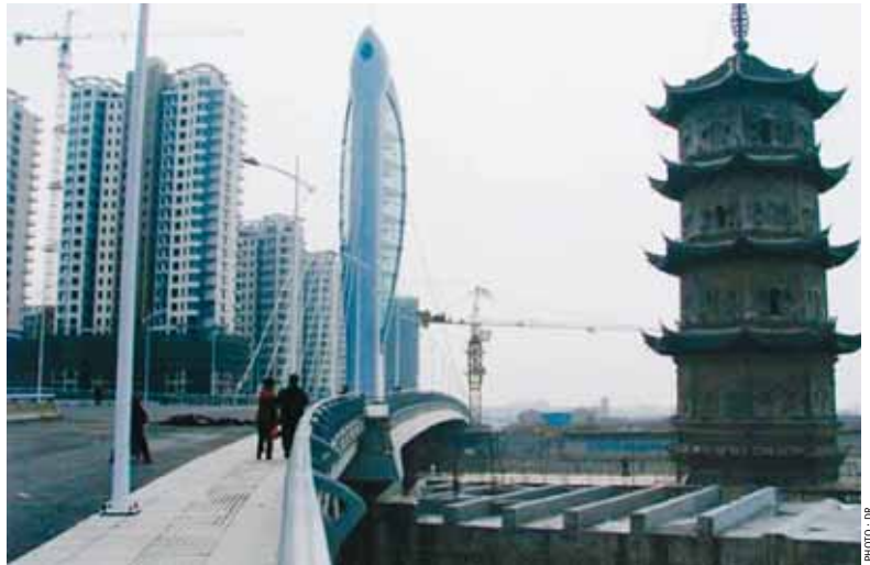
Après trois ans de hausse ininterrompue, la monnaie chinoise stagne depuis juillet et a même connu un épisode de faiblesse qui a inquiété les marchés la semaine dernière

Autre manifestation de la crise: la chute de 36,52% en glissement annuel des investissements directs étrangers (IDE), qui décéléraient depuis dix mois, et ont représenté 5,32 milliards de dollars en novembre. Cela a ramené leur progression depuis le début de l'année à +26,29%, période durant laquelle ils ont totalisé 86,42 milliards de dollars. Pour les experts, le ralentissement des IDE -- qui étaient encore en hausse de 35% sur les dix premiers mois de l'année, après +40% sur les neuf premiers mois -- est lié à la crise internationale du crédit qui raréfie les financements des investisseurs potentiels, ou les pousse à l'attentisme, par aversion du risque. La Conférence des Nations unies pour le commerce et le développement (Cnu-