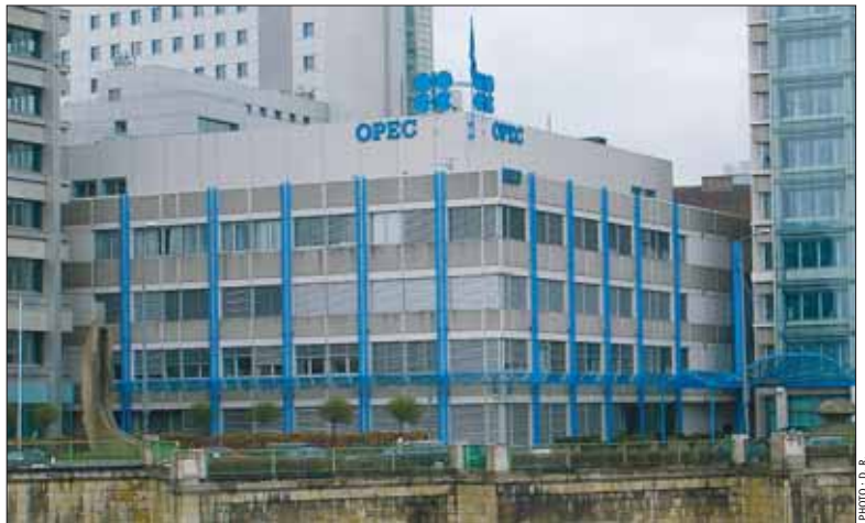
Le siège de l'OPEP

Reboostés par la perspective d'un accord de réduction de la production de l'OPEP, les prix du baril ont atteint mercredi 44,03 dollars à Londres et 45 dollars à New York, et ont même pris jeudi plus de 10% à New York et 10,25% à Londres. Cette hausse fut cependant de courte durée et dès vendredi les bourses ont chuté, effaçant une partie de leurs gains spectaculaires réalisés la veille. Sur le New York Mercantile Exchange (Nymex), le baril de light sweet crude pour livraison en janvier a fini à 46,28 dollars, en baisse de 1,70 dollar par rapport à son cours de clôture de jeudi. A Londres, le baril de Brent de la mer du